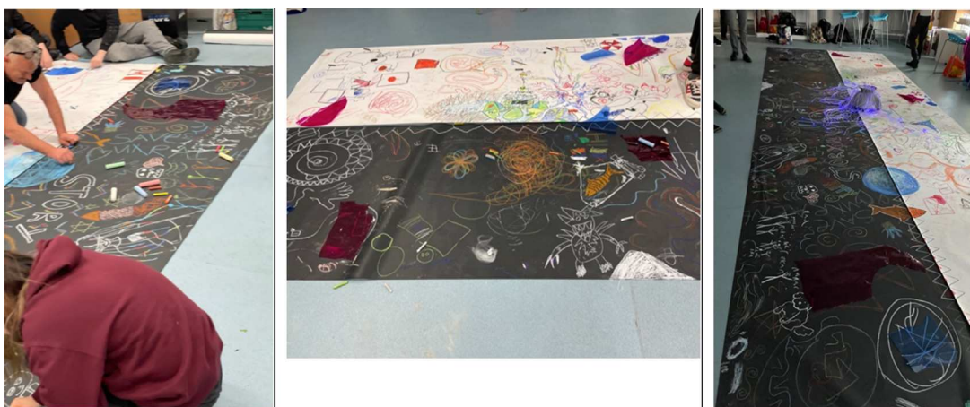
Figure 4 : Steve et son collage haut en couleur