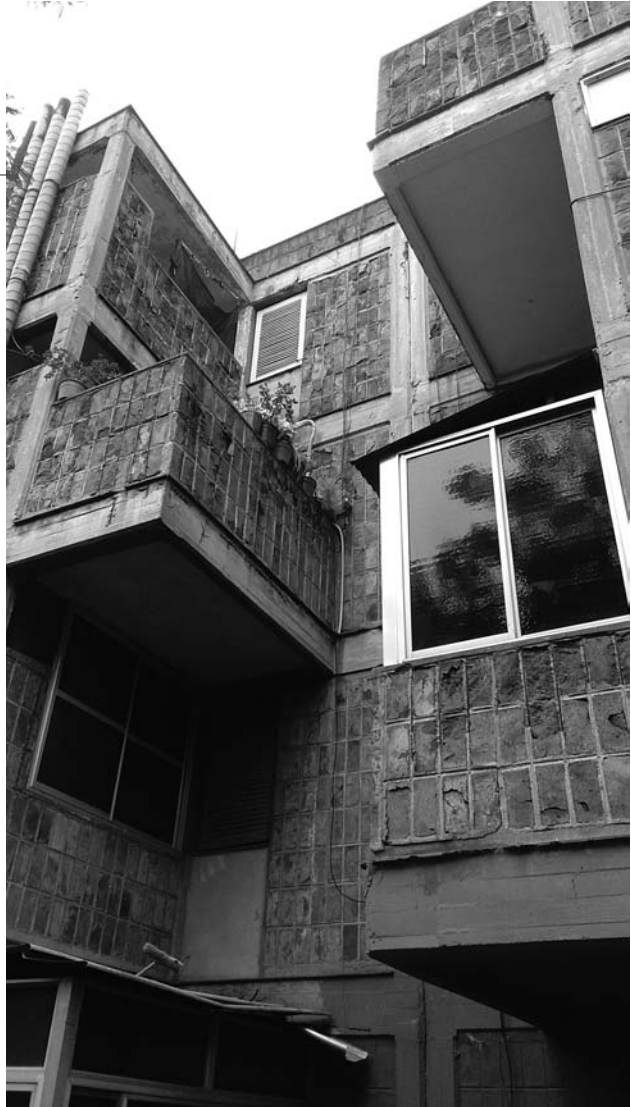
FIGURA 6. Barrio Justo Suárez: acercamiento a dormitorio y terrazas; se aprecian también paneles de ladrillo autoconstruidos