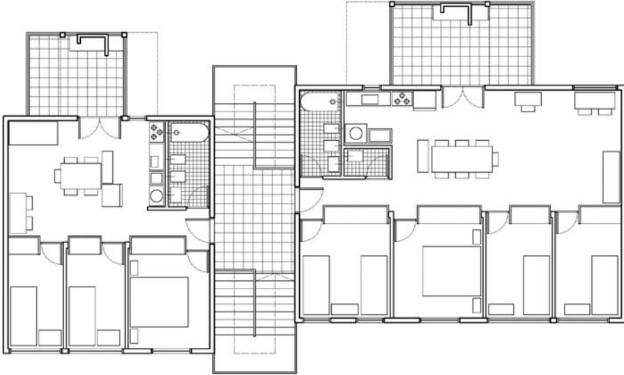
FIGURA 4. Ejemplo de diseño en planta de dos unidades de vivienda de tiras bajas en Barrio Justo Suárez

Fuente: Calcado por la autora del original en publicación Trama (1982) Barrio Justo Suárez: Plan Piloto Realojamiento Villa 7 (3), 10-20.