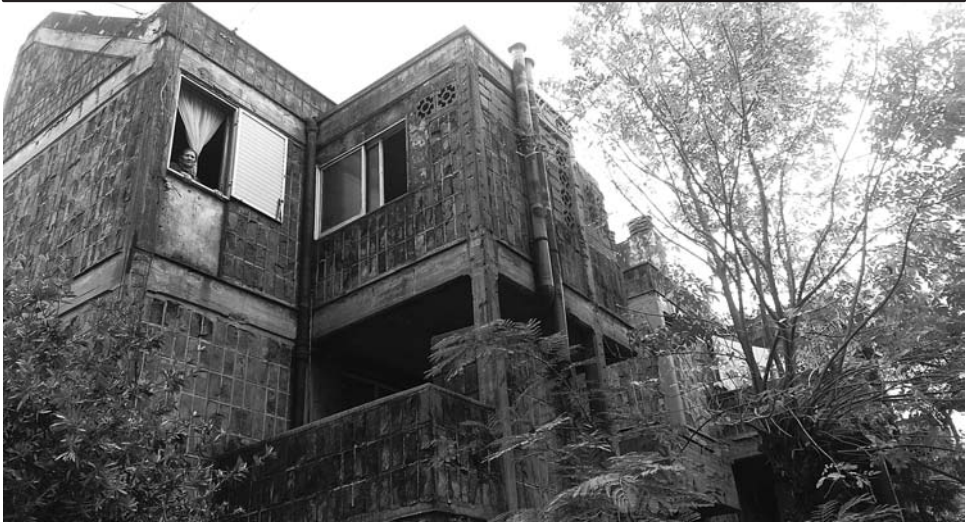
FIGURA 5. Barrio Justo Suárez: acercamiento a dormitorio y terrazas; se aprecian también paneles de ladrillo autoconstruidos