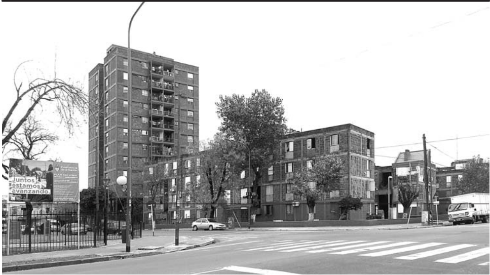
FIGURA 1. Barrio Justo Suárez, esquina Bragado y avenida Lisandro de la Torre (esta última de nombre Tellier en la época que el barrio fue construido)