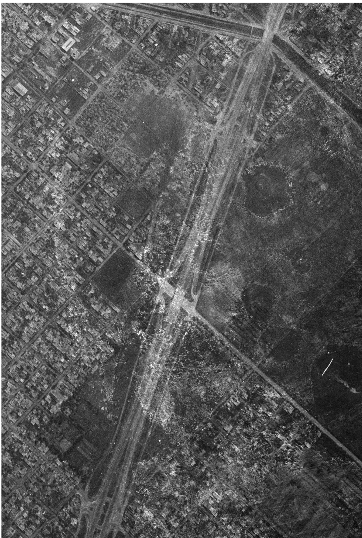
Figura 4. Fotogramas año 1956. Recorte. Fuente: INSTITUTO GEOGRÁFICO NACIONAL. Buenos Aires.