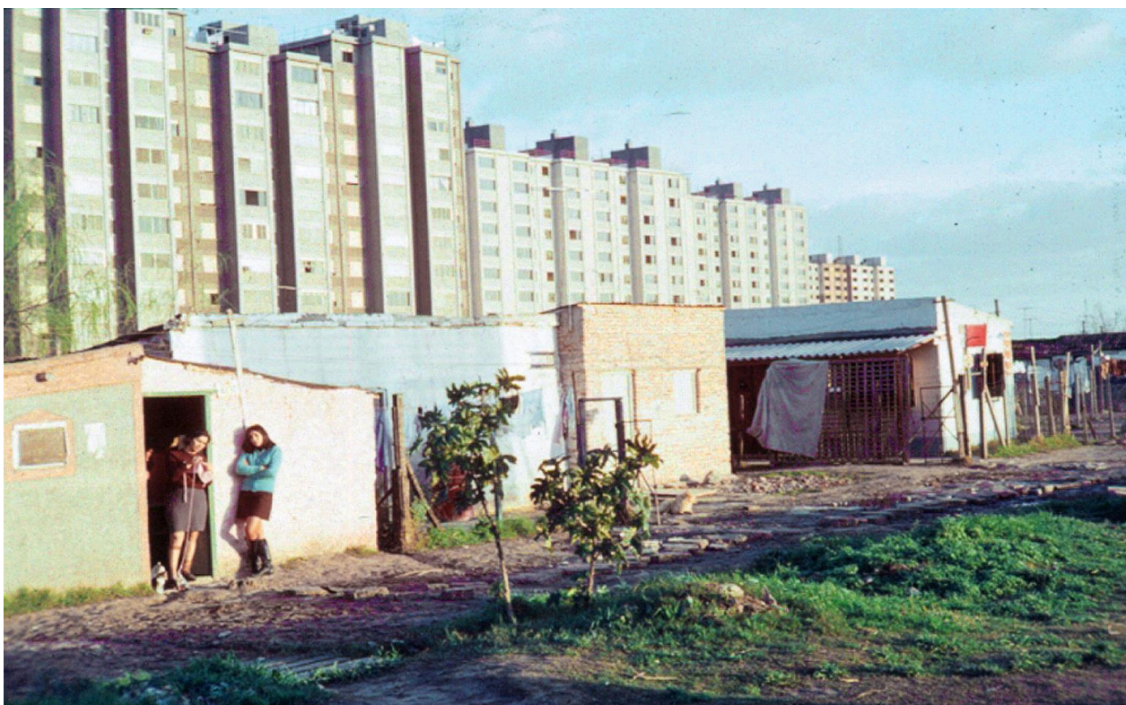
Figura 8. Villa La Lonja (5; delante) con el conjunto habitacional PAB "C" (Nágera) de fondo, circa 1968 (mi estimación).

interesante notar que Alfred Wilson, un experto contratado por la CMV en 1965 para dar un diagnóstico de las villas en Dellepiane y Escalada, no se pliega a este discurso sino que más bien lo subvierte: 'son aterradoras [...] parecen estar avanzando sobre ellas' escribe Wilson en referencia a los pabellones y las villas respectivamente (WILSON, 1965, p. 76). El reporte de Wilson, de todos modos, no dejaba de ser funcional a los objetivos de la CMV, la cual incorporó sus resultados básicos como parte de su pedido de financiación ante el Banco Interamericano de Desarrollo para el programa urbano Parque Almirante Brown (PAB) (COMISIÓN MUNICIPAL DE LA VIVIENDA, 1965). Cabe destacar que el Plan Municipal de Vivienda se encontraba, a nivel administrativo, desvinculado del PAB, que era la iniciativa más importante de la CMV en el área (y de hecho su iniciativa más importante durante el período bajo análisis).