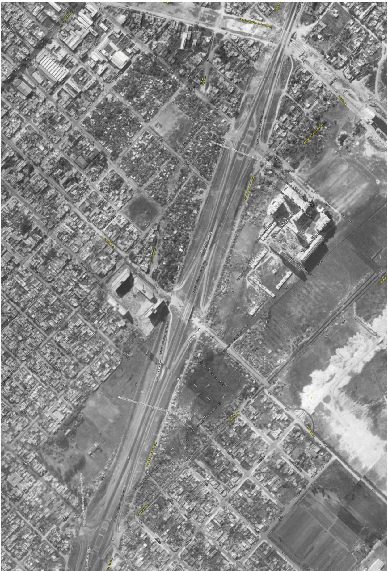
Figura 5. Vista aérea 1965. Recorte.