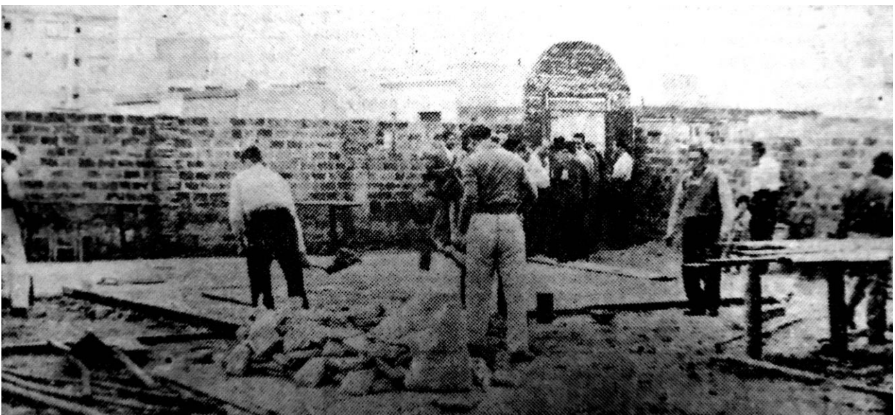
Figura 6. Comisión Vecinal de Villa Cildáñez construyendo su sede.

típicamente de bordes a centro, por una cuestión de accesibilidad a medios de transporte pero sobre todo a canillas públicas (GEOS S.R.L. ING. CONSULTORES, 1971). Asimismo, en terrenos inundables como los de la zona sur, la distribución espacial del crecimiento de las villas se veía condicionada por el nivel altimétrico de los diferentes sectores del terreno. Si bien los vecinxs 4 no se conocían necesariamente de antemano, a menudo iban autoconvocándose para resolver las cuestiones más urgentes que requerían acción colectiva: la extensión del trazado de redes de agua y luz; el aumento de canillas disponibles y su abastecimiento; el relleno de terrenos; y la construcción de capillas, dispensarios, y otros usos comunes (Fig. 6). Aunque muchos de los grupos surgidos de estos esfuerzos colectivos fueron circunstanciales y se disolvieron una vez cumplidos sus propósitos más inmediatos, otros cobraron permanencia y se convirtieron en comisiones vecinales estables (LA HORA, 1958I, 1959; LA VOZ DE LAS VILLAS, 1965c; CRONISTA MAYOR DE BUENOS AIRES, 2000, 2002a; ZICCARDI, 1977; AUYERO, 2000, p. 47-60).