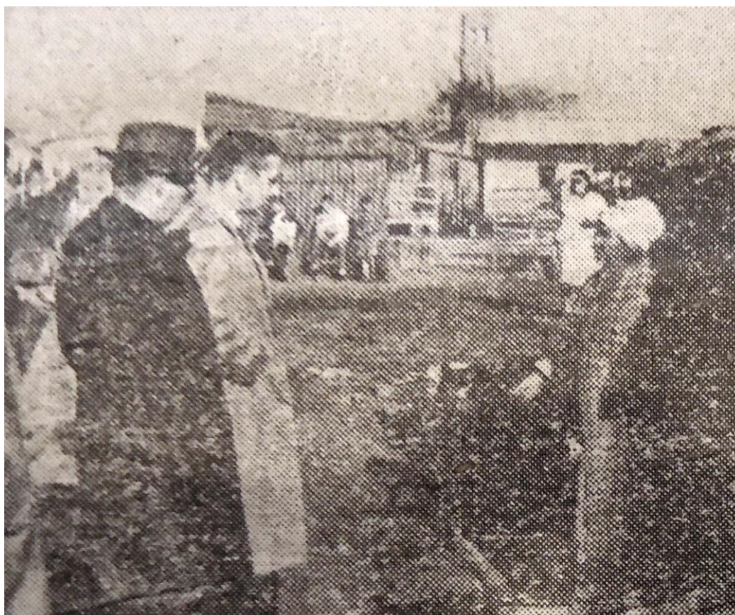
Figura 7. Concejales porteños de la Comisión Especial para las Villas Miseria visitan Villa Cildañez.