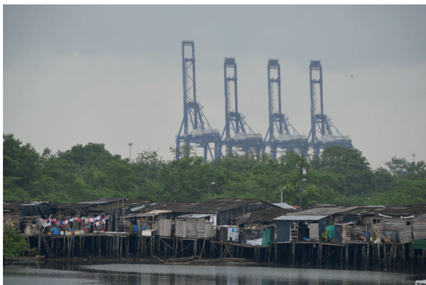
Imagen 2. Buenaventura, un distrito de contrastes